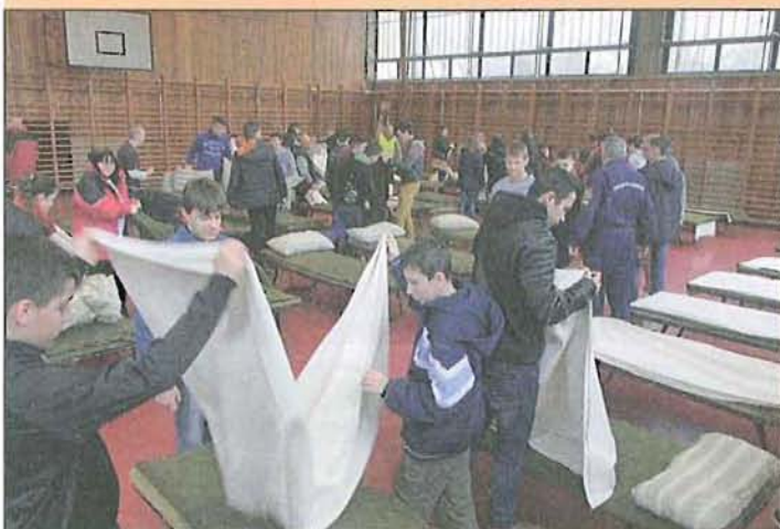
A segítők lelkesen hajtogatták a lepedőket