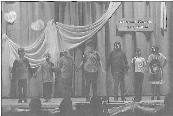
A 6. b osztály jelenete végén

Február 14-e reggelén mindenki felelevenítette a Bálint napi hagyományokat, majd felöltötte magára télűző maskaráját, s elindult az alakoskodó felvonulásra. Diákvezetőink a Járási Hivatal előtt átadták a „KISBÁLINTOS” diákok okoskodásait a város, a já-