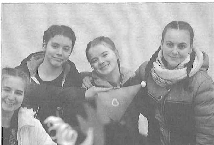
7. a osztályos lányok

rás és a tankerület vezetőinek, s az idén első ízben ezen intézmények megválasztott diákvezetőinek is. A nap csúcspontja – természetesen – a Kállai Ferenc Kulturális Központban előadott osztályprodukciók voltak. Magas színvonalú előadásokat láthattunk, melyek a diákok, osztályfőnökök kreativitását és sokszínűségét tükrözték. Az utolsó „fellépők” – a diákvezetők kérésére – a felsős pedagógusok voltak, akik az Illés együttes népszerű szerzeményét, az Újra itt van... kezdetű dalt énekelték el.