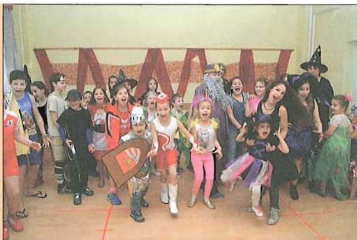
Jót játszottunk az ovisokkal