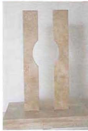
Kb. 3 méter magas lett volna Oláh Mátyás szobrászművész alkotása. A képen az '56-os emlékmű makettje

Sem az 5 millió forintos elnyerhető állami