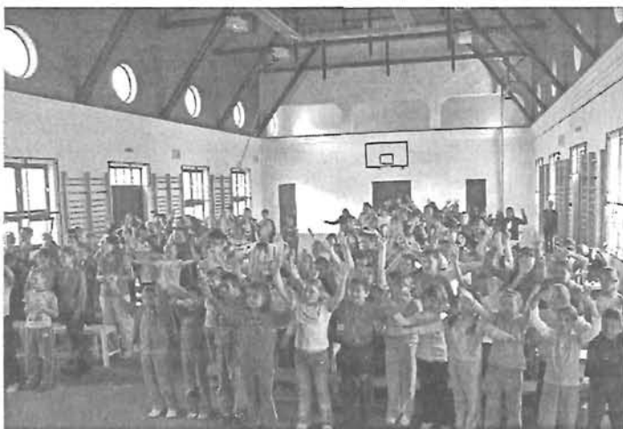
Hírek a Szent Gellért iskolából, cikk az 5. oldalon

„Az emlékezéshez nem emlék, hanem szeretet kell, és akit szerettünk azt sosem feledjük el!”