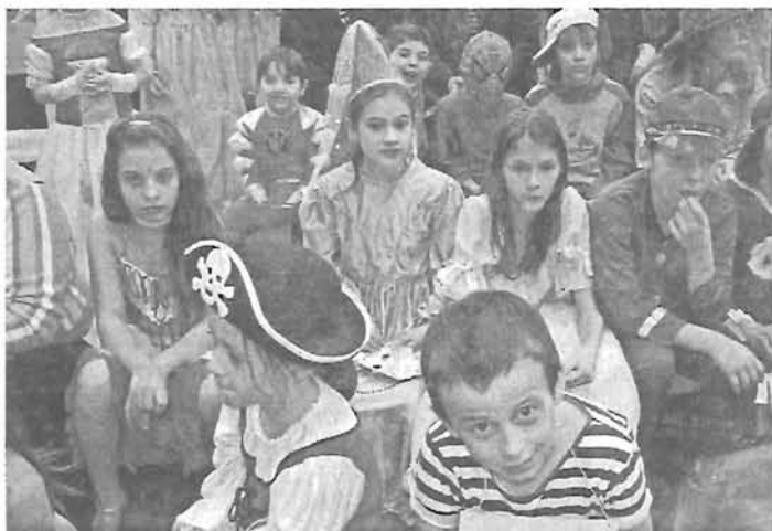
Rózsashegyis híreink a 9. oldalon