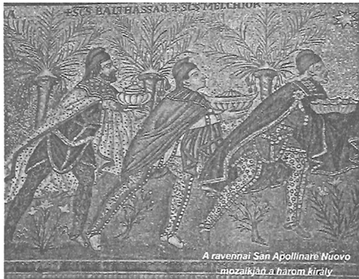
A ravennai San Apollinare Nuovo mozaikján a három király

Zajtai Ferenc zsidó volt-e Krisztus című könyvében nagyon részletesen áttekinthető a Közel-Kelet történelmét. Ezt írja Ezékiel szavai szerint: „És lőn az Úr beszéde hozzám, mondván: Embernek fia! Add tudtára Jeruzsálemnek az ő utálatosságait. És mondjad: Így szól az Úr Isten Jeruzsálemnek: A te származásod és születésed