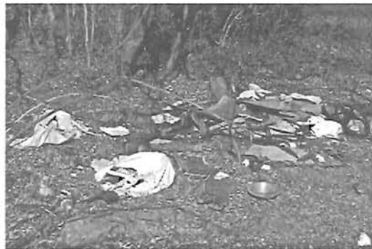
Szemét a folyó partján