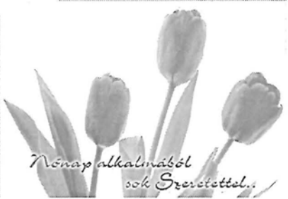
Nőnap alkalmából sok Szeretettel..

A Nőnapon szerelettel köszönljük az anyákat, feleségeket, a nőket, lányokat ezzel a szerény csokorral, de annál nagyobb tisztelettel, szeretettel!