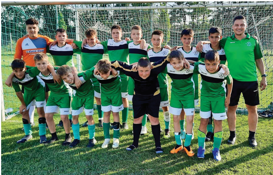
Gratulálunk fiatal focistáinknak és az edző kollégáknak!

Veretlenül zárta a szezont a Gyomaendrődi Gyermeklabdarúgó Egyesület U13-as csapata is. A tavaszt a Grosics Akadémia hasonló korú csapata elleni győztes (4-2) visszavágó edzőmérkőzéssel fejezték be Gyulán. Nagyszerű teljesítményt nyújtottak a fiúk, nem találtak legyőzőre a 16 bajnoki és 2 edzőmérkőzésen (15 győzelem, 3 döntetlen, 95-27-es gólarány).