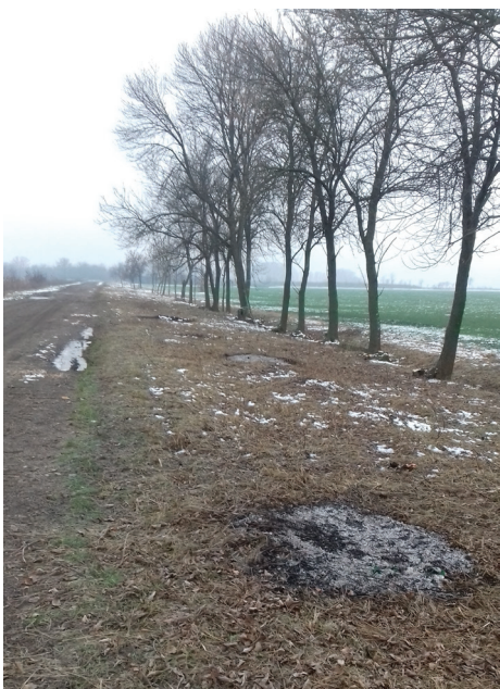
kicszerjézett földút széle, (Vitéz dűlő)

A járási startmunka „bio és megújuló energia felhasználás” mintaprogramjának keretében a földutak szélén kitermelt gallyak feldarálásával, jelentős mennyiségű darálék keletkezik. A tüzelőanyagot értékesíti az önkormányzat, valamint egy brikettáló gép segítségével brikettet állít elő. A brikett fűtésre praktikusabban és hatékonyabban használható fel a daráléknál, valamint könnyebben is értékesíthető.