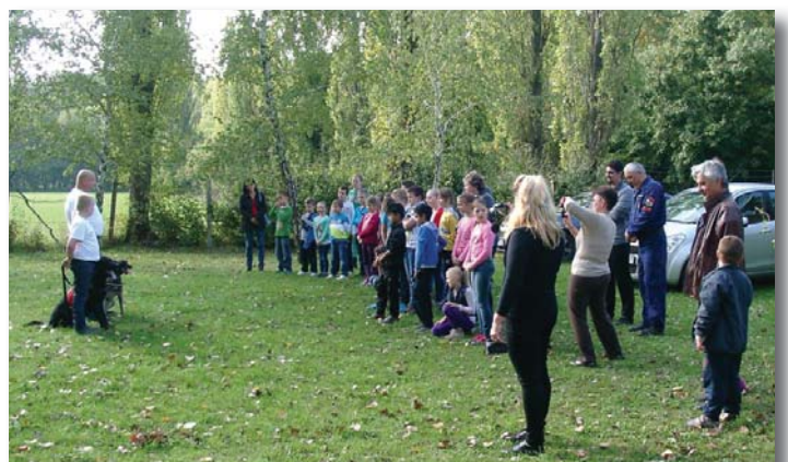
Vidra Mentőcsoport bemutatója