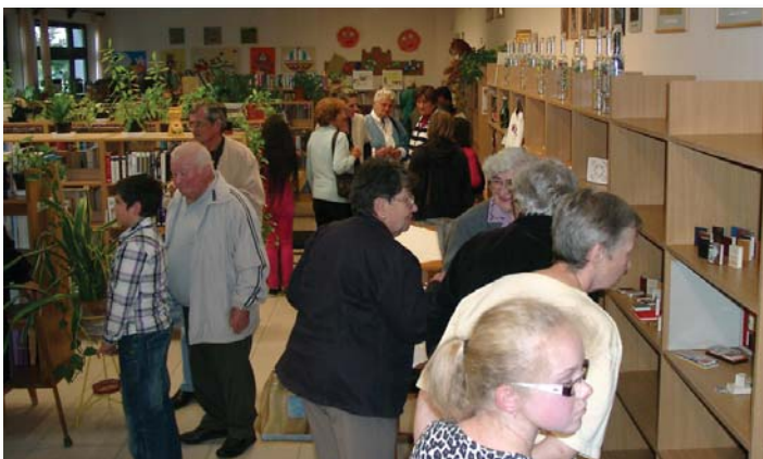
Kiállások a könyvtárban