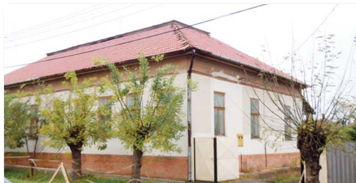
Körös Látogató központ