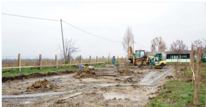
Bárka Látogató központ alapozás