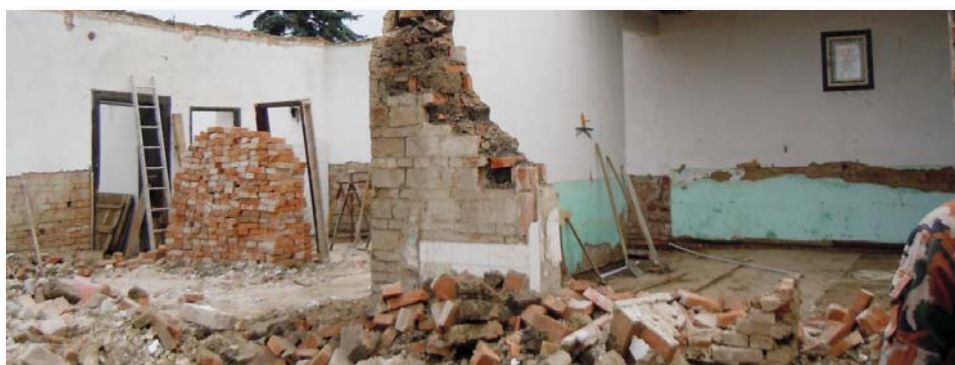
Szent Antal Zarándok szálláshely és Szent Antal kenyérsütőház