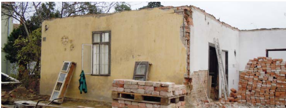
Szent Antal Zarándok szálláshely és Szent Antal kenyérsütőház