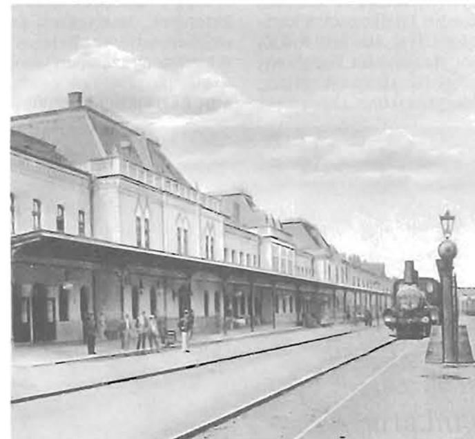
A nagyváradi vasútállomás 1903-ban