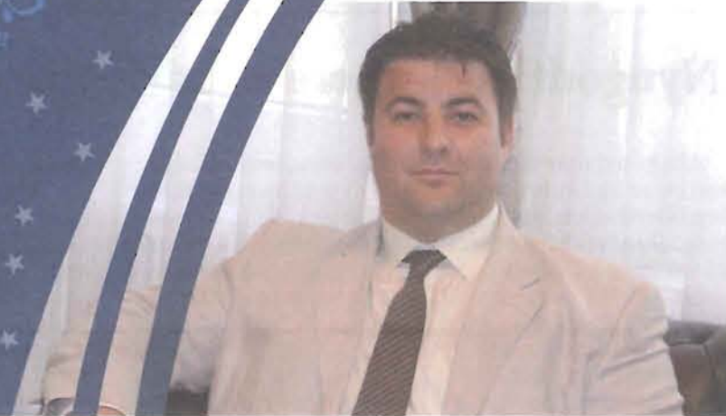
Erdős Norbert - országgyűlési képviselő, kormány megbízott