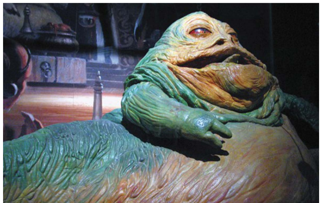
A fent felsorolt fogadalmak betartása esetén, egy év múlva ez a kép fogadhat bennünket