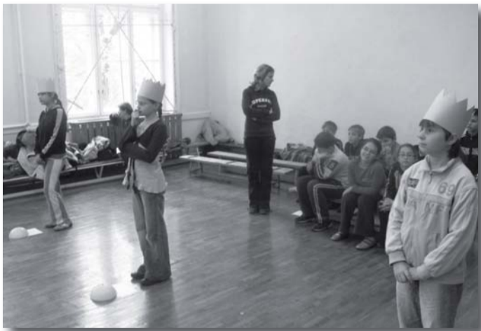
Három hangyakirálynő is megfért a bolyban

Október elején a kicsik Fecskeavatójára egy szüreti mulatság keretén belül került