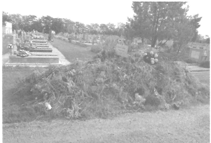
Gyomai köztemető = szeméttelap???