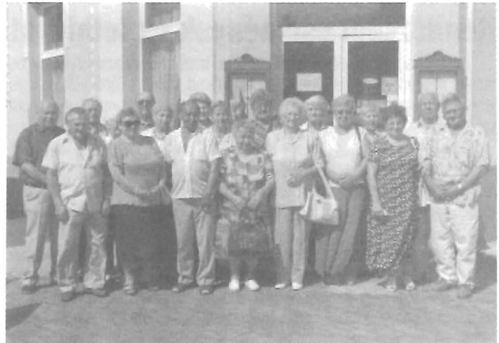
A gyomai 1. számú Általános Iskolában 1951-ben végzett tanulók találkozója volt augusztus 27-én.

postai úton, a postabélyegző dátuma: 2011. szeptember 13.