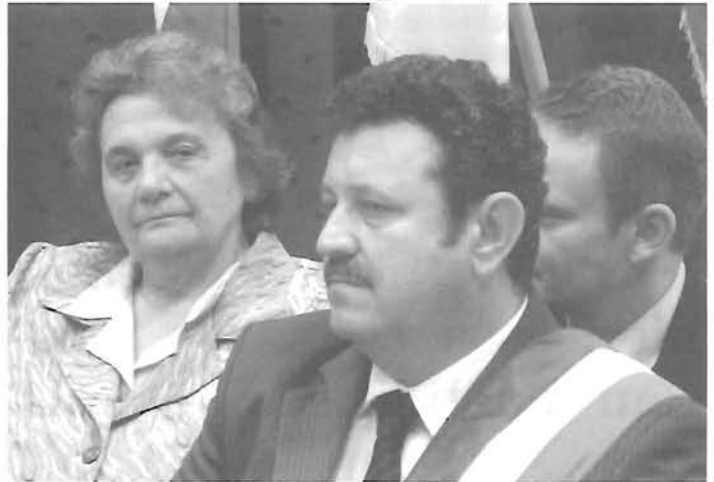
A román polgármester

kapcsolható munkásságához, amivel az itt élő emberek életkörülményeit jelentősen javította. Többek között megemlíthető az ivóvíz-program továbbvitele, szennyvízhálózat kiépítése, útépitések, fürdő-beruházás, kommunális hulladéklerakó megépítése, belvíz-program, az idősek napközi otthonának fejlesztése, óvodák, iskolák fejlesztése.