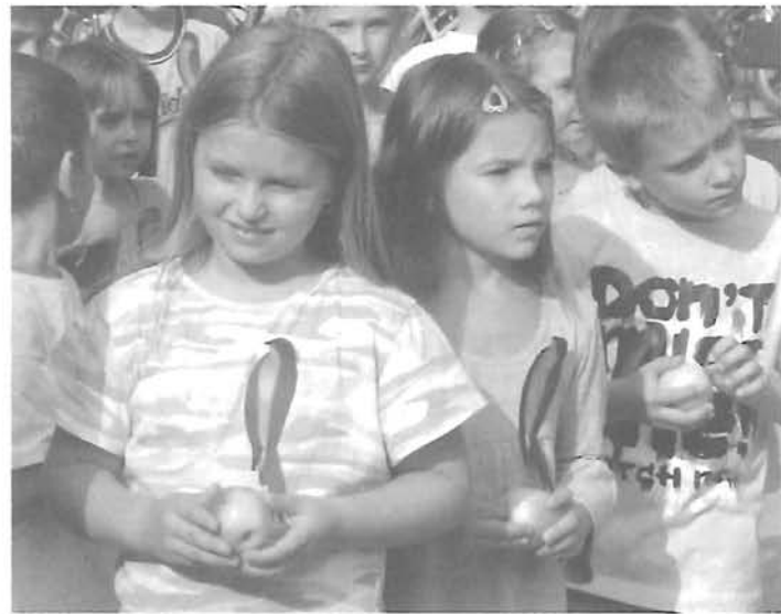
A Kis Bálint Általános Iskola és Óvoda elsős diákjainak Fecskeevató rendezvénye (Cikk a 7. oldalon)