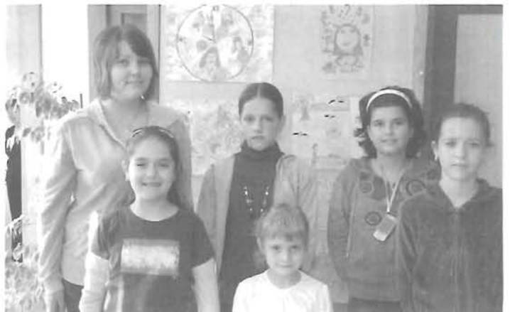
A Takszöv Rajzpályázat díjazottjai (Cikk a 7. oldalon)