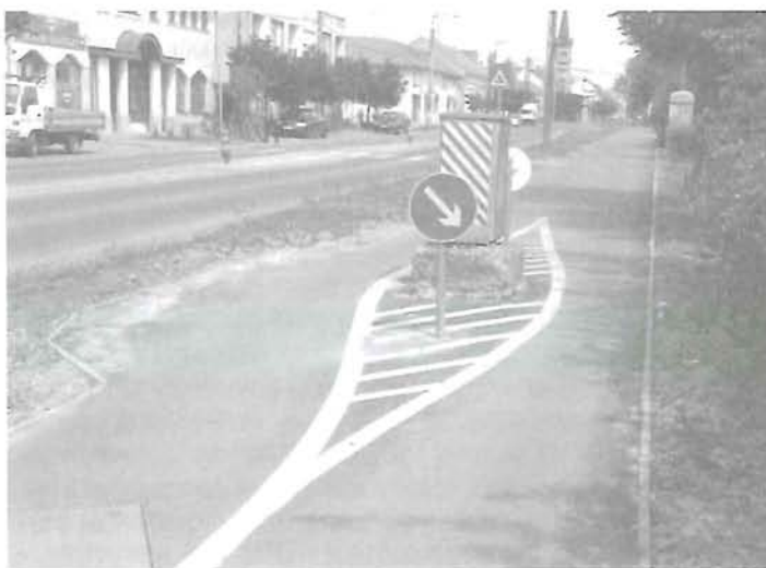
Akadály az út közepén