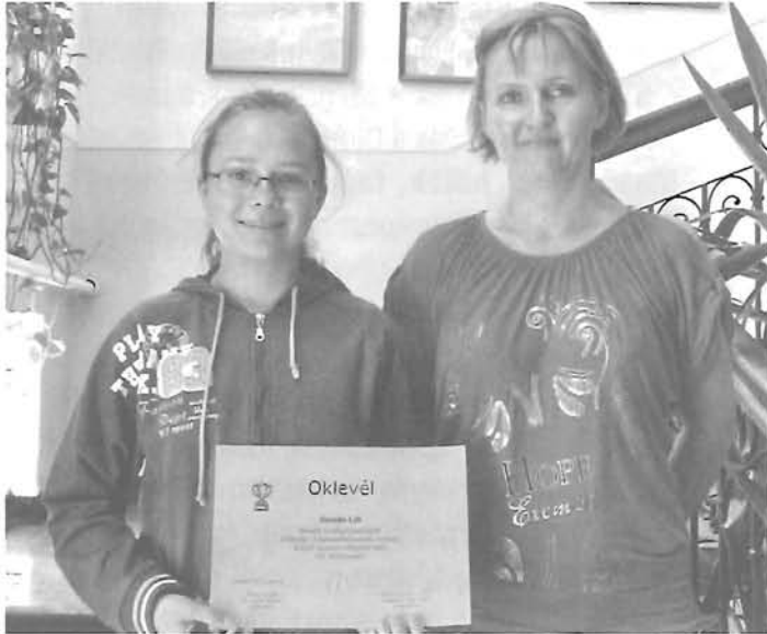
Siker a helyesírási verseny Kárpát-medencei döntőjén

Ezzel a programmal a 2011/2012-es tanévben immár negyedik éve követik a fenntartható fejlődésre vonatkozó nevelési célkitűzéseiket.