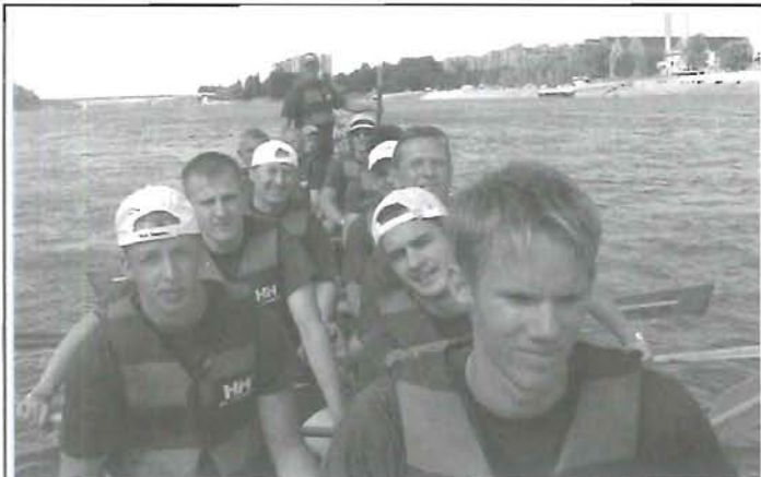
Magyarország EU-elnökségi mandátumának záróünnepségén Budapesten, a Dunán rendezett SÁRKÁNYHAJÓ versenyen Gyomaendrőd csapata (hajója) a harmadik helyen végzett!!! Gratulálunk!!!

Az elmúlt időszakban több alkalommal lopás történt vikendházakból, legtöbbször a Sirató- és Bónom-zugban. Az elkövető szinte minden esetben a nyitva hagyott kapun jutott be a telekre, vagy a nyitva hagyott gépkocsiból, illetve nyaralókából vitt el értékeket. Kéri a rendőrség a lakosságot, hogy ne könnyítsék meg a bűnözők dolgát, tegyenek meg mindent érteik védelmében, ne hagyják nyitva a kaput, gépkocsit, hétvégi házat!