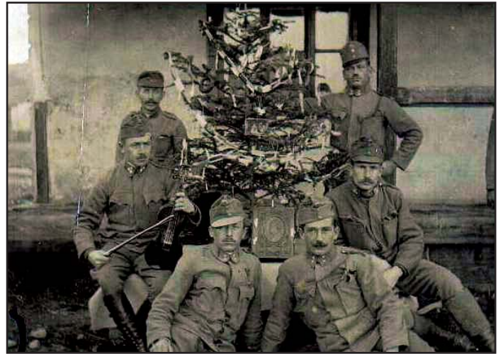
Karácsony a fronton 1916-ban

pusztítást végző ütegek. Ezekre fagytak halálra a Don kanyarulatainál, és hiába védte dicsőséggel az Uz völgyét a magyar haderő és kényszerítette fél térdre a román hadsereget, mégis a vesztesek táborába kerültünk. Sokan meghaltak ebben az öldöklő vérfürdőben. Alig volt olyan család, aki ne vesztett volna el egy férjet, testvért, fiút vagy édesapát. A kínzó társadalmi desperáció nem szűnt meg a háború lezáródásával, hiszen a vörösforradalom, majd a román megszállás és a háborúban megrokkant emberek erkölcsi és etikai értékeinek deformációja kínozta a falvak és városok életét. A hadiségelyen tengődő családok sokszor megvetéssel fogadták a háborúban lelkileg és testileg megrongcsolt tagjaikat. A hazatérő katonákat az éhség, a kimerültség várta itthon. Az addig színes falusi öltözetek feketévé váltak, a parasztházak