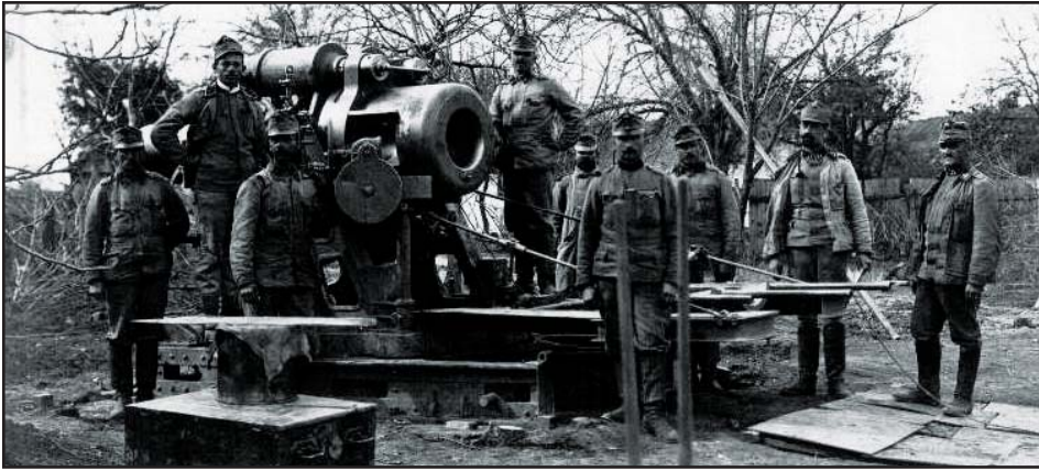
A monarchia csodafegyvere 1916-ban

100 éve tört ki az első világháború, melyet követett az úgynevezett magyar „béke”. Az 1920-ban megkötött békediktátum, hazánkat feldarabolta és megcsönkította.