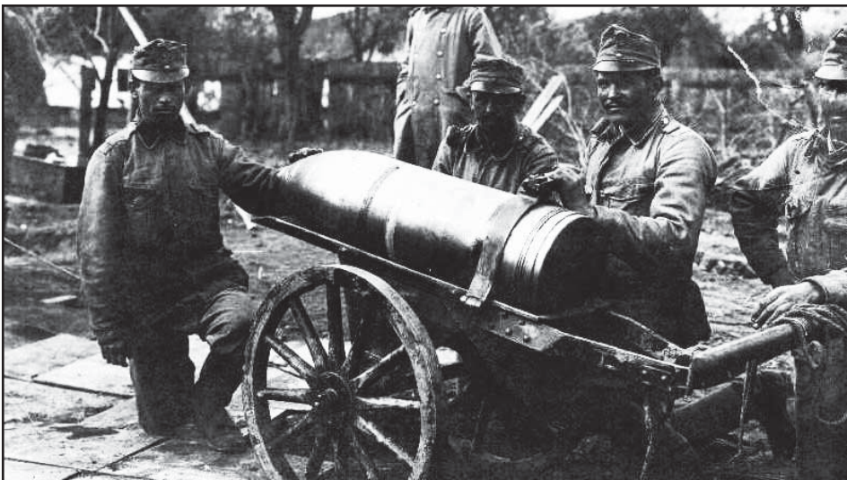
A pusztító üteg lövege 1916-ban

1914-ben, hazánkban a feudális állapotok elavulása, a polgári értékek erősödése, a vállalkozói szemlélet megjelenése volt észlelhető. Az ezeréves ország milleniumi építkezései, a falvak és városok arculatának megváltozásai köszöntötték az 1900-as évet. A magyar huszárság utolsó fellángolása volt ez az időszak az emberirtó tömegpusztító fegyverek megjelenése előtt.