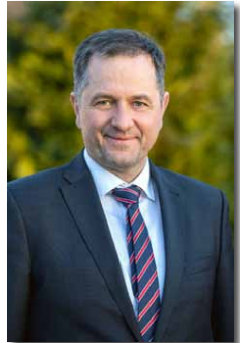
Dankó Béla országgyűlési képviselő