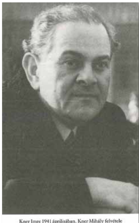
Kner Imre 1941 áprilisában.

meg, hogy ezt a magyarságot kétségbe vonja, elvonja tőlünk. De éppen mert zsidók vagyunk, és mert mások ezt kétségbe vonják, nekünk be kell bizonyítanunk, hogy értékes és jó magyarok vagyunk, ennek az egyetlen módja: mennél több, mennél jobb, mennél értékesebb magyar munkát végezni. [...] Nem vagyok már rugalmas. (...folytatás a következő oldalon)