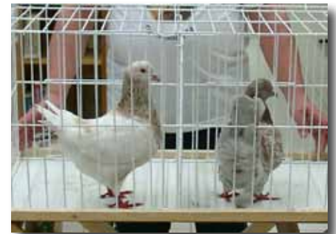
A magyar autósex tyúkgalambot, amely húsgalamb is, Gyomaendrődön tenyésztették ki.

programot közvetlenül a Gyomaendrődi Járási Hivatal koordinálja.