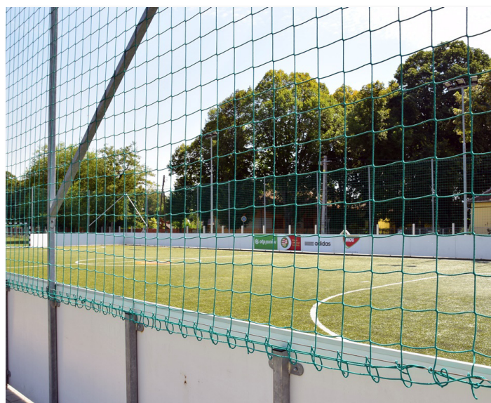
Műfüves pálya kialakítása a gyomai Sportpályán