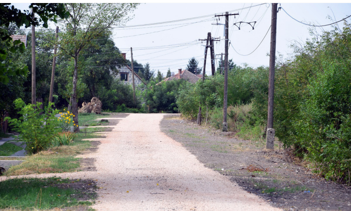
Vadász utca, felújítás