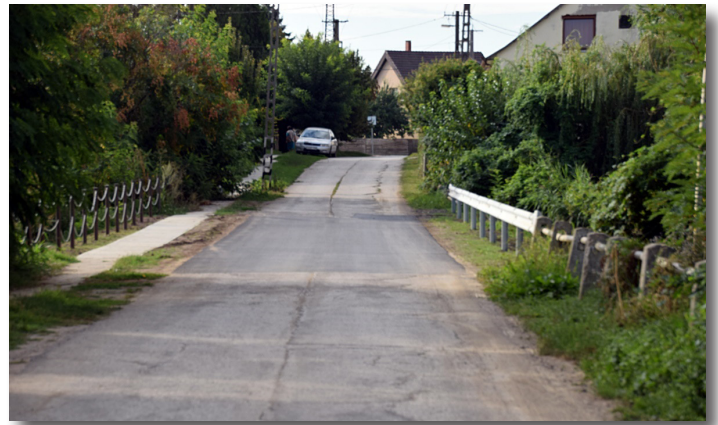
Csókási áteresz felújítása