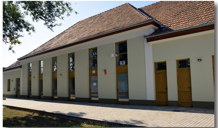
Endrődi tornaterem felújítása