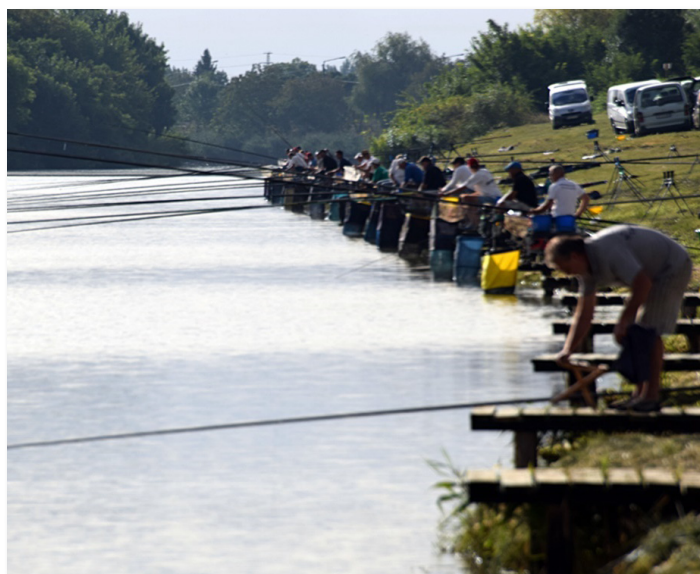
Fűzfás-zugi versenypálya kialakítása