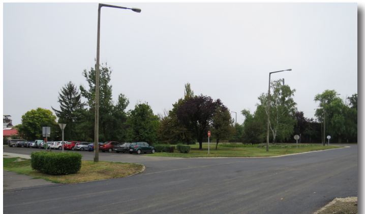
Aszfaltozás a MÁV állomás körül