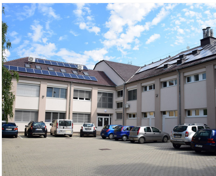
Városháza energetikai korszerűsítése