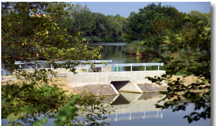
Fűzfás-zugi áteresz kialakítása