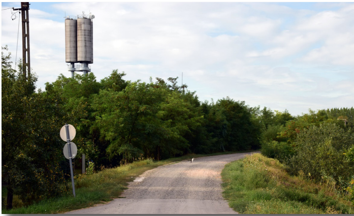
Besenyiszei út felújítása, kiscgát