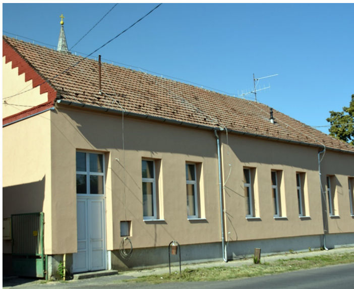
Orvosi rendelők energetikai felújítása