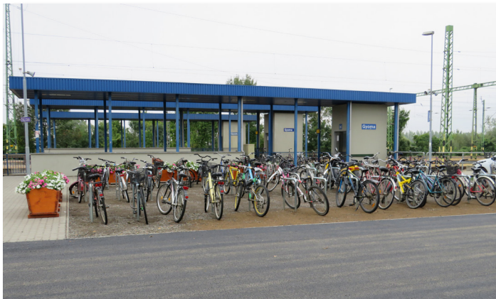
Kerékpártárolók-, parkoló bővítése