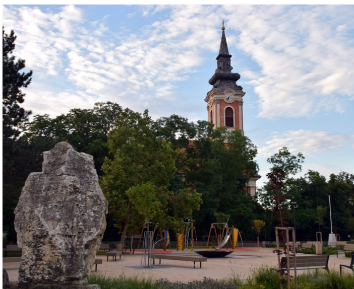
Hősök Tere felújítása