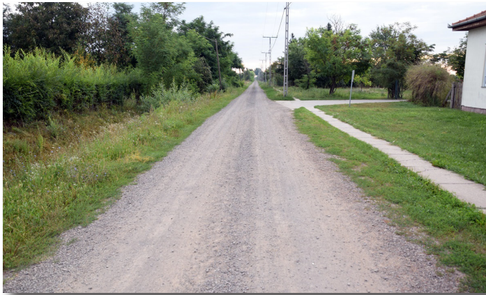
Öregszőlősi utak felújítása