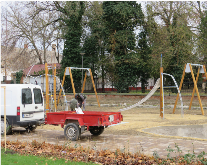
Hősök tere átépítése