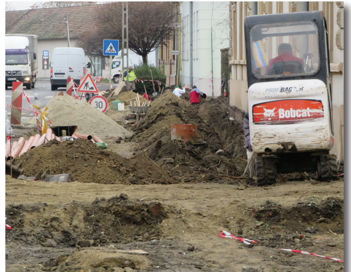
Kerékpárút építés Endrődön