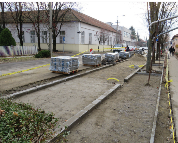
Parkoló építés a Kossuth úti óvodánál