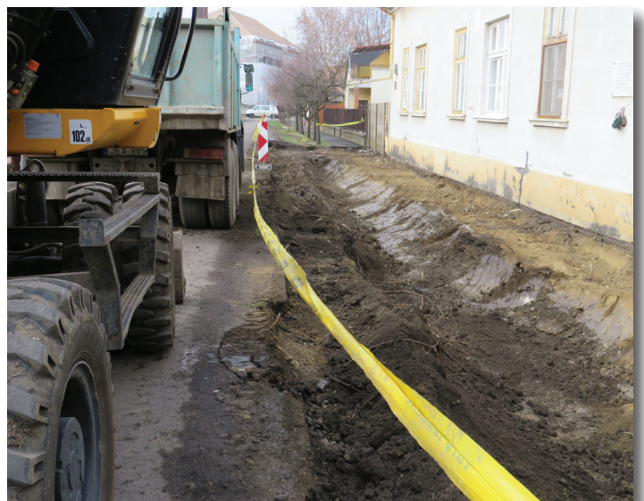
Parkoló építés a Piko utcában az orvosi rendelőnél