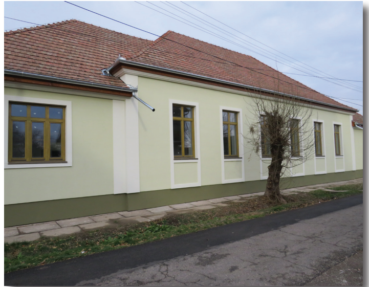
Az átalakított, felújított kistornaterem