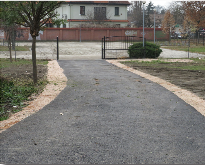
Átjáró az endrődi orvosi rendelő udvaráról a piacra