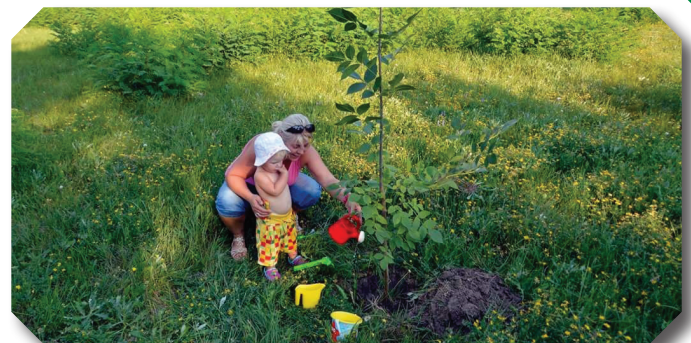
Az első helyezett fotó