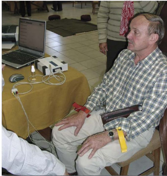
A helybeni ingyenes szűrővizsgálat lehetőségét sokan kihasználták, népszerű volt a stressz-szűrés is.