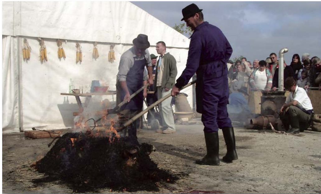
Az érdeklődők közül a legtöbben most láthattak először szalmás perzselést.