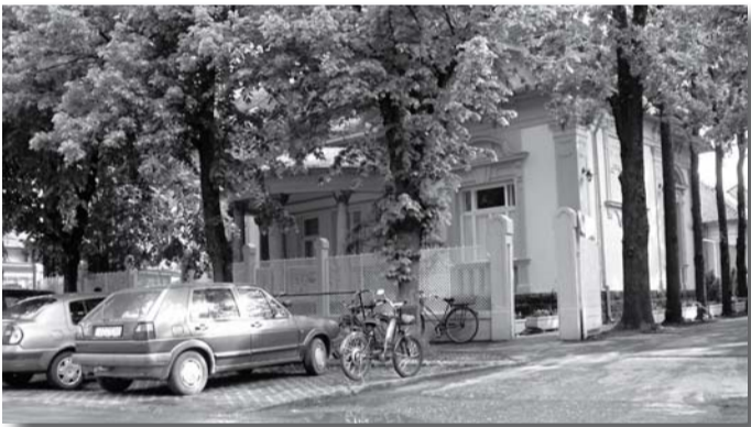
Sikerült helyben megoldani a kardiológiai ellátást és a csontritkulás gondozását is.