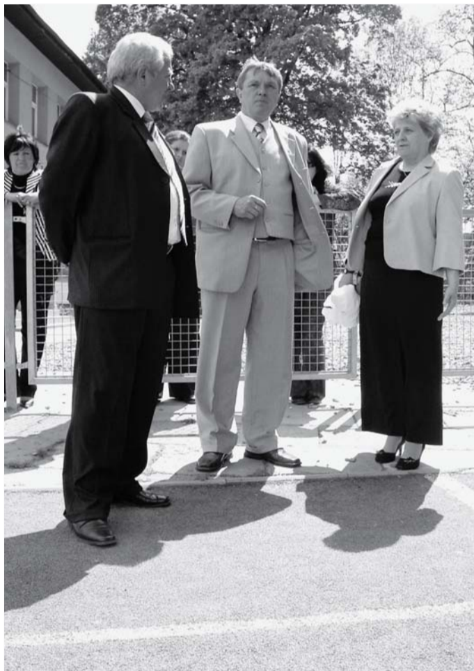
A gyomaendrői és a lengyel polgármester a műfüves pálya mellett a tolmács társaságában

Ha a társadalom tagjai a legfontosabb célokban egyetértenek, ez kihat a minden napi életre, így a gazdaságra is. Lengyelországban kisebb az adó, mégis gyors ütemben növekszik a gazdaság. Ha valaki kiutazik Lengyelországba, megtapasztalhatja, miként működik egy normális ország.