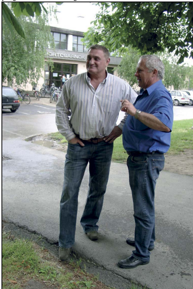
Növényi Norbert jelenléte még jobb teljesítményre sarkalta a résztvevőket.

olimpiai bajnok, kick-box világbajnok, aki hivatásos színész is. Várfi András polgármester társaságában megtekintette a rendezvény helyszíneit. (Folytatás a 3. oldalon)