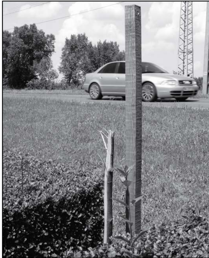
Kitört hársfa a vízművek előtt

Tavaly a Fő úton telepített, előnevelt egyetlen vörösmogyoró oltvány kitörése esetében a kárérték bruttó 108 ezer forint. Hasonló értéket képvisel egy piros virágú díszgalagonya is. Egyetlen 2005-ben telepített ezüsthárs alapfaj kitörése után mintegy 36 ezer forint a kárérték. Ha szétnézünk utcáinkon, zöldterületeinken, számos kitört fa maradványát láthatjuk, ezek tavasszal még nagyon szépen kihajtottak. Ezért kérjük, hogy aki információval tud szolgálni a fák kitöréséről, a virágok és a cserjék lopásáról, a rongálók megállítására érdekében bejelentésével segítse a polgármesteri hivatal, a rendőrség és a polgárőrség munkáját.