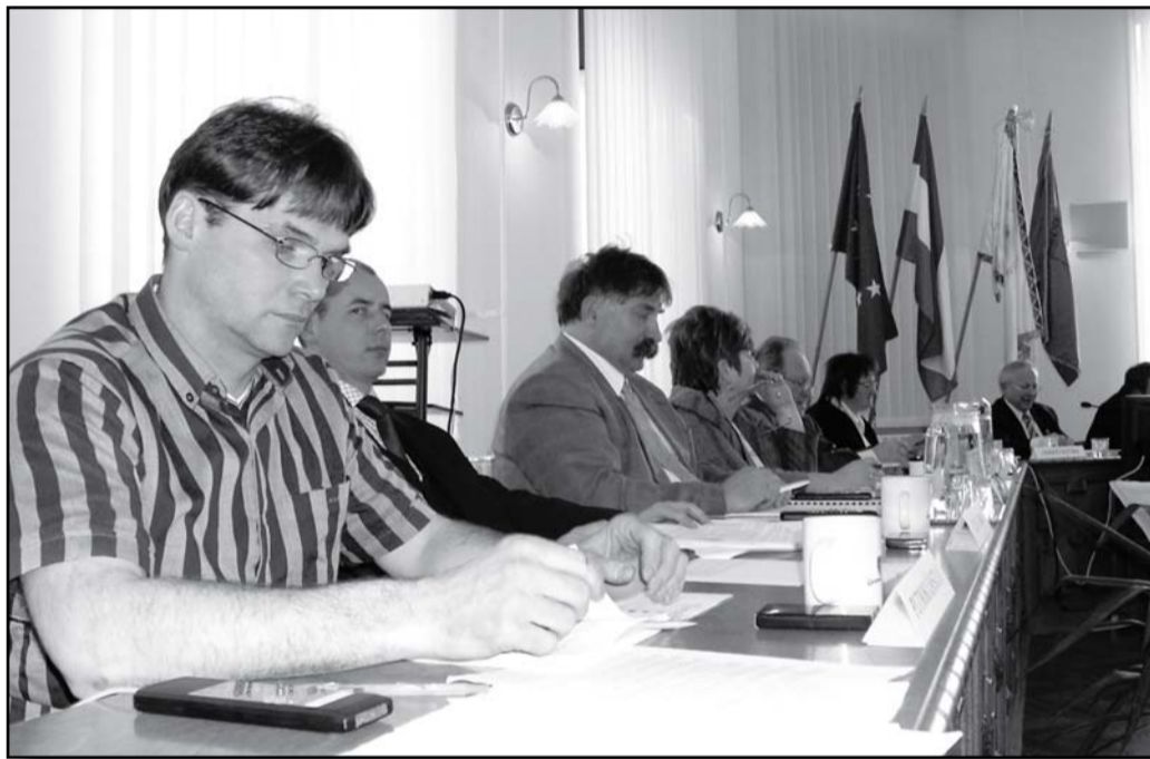
A testület konszenzussal döntött a fürdőfejlesztésről, miként korábban a kötvény kibocsátásáról és a gimnázium jövőjéről.

A tervek alapján a jelenlegi épületek megmaradnának, a bővítés a mostani kemping területén valósulna meg. Az új részen hullám-, illetve élménymedence és uszoda épülne, továbbá bővílnének a wellness szolgáltatások is. A tervezők szerint az önkormányzatnak nyáron kellene gondolkodnia a beruházás megvalósításán, ősszel kellene meghoznia a döntést, és már 2009 őszén, legkésőbb karácsonyan már vendégeket is fogadhatna a kibővített fürdő. A fejlesztés eredményeként idegenforgalomból az önkormányzat adók formájában 50-60 millió plusz bevételhez juthatna.