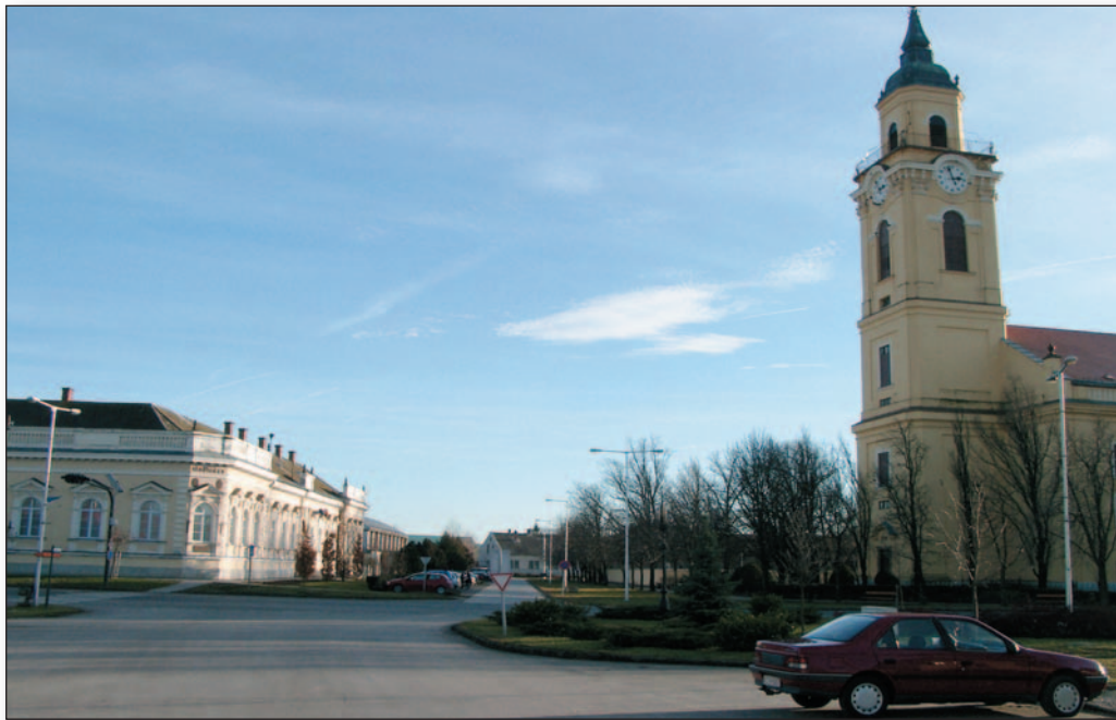
A fejlesztések eredményeként javulhat a gyomaendrődiek életminősége

A kötvény kibocsátása segíti a fejlesztéseket