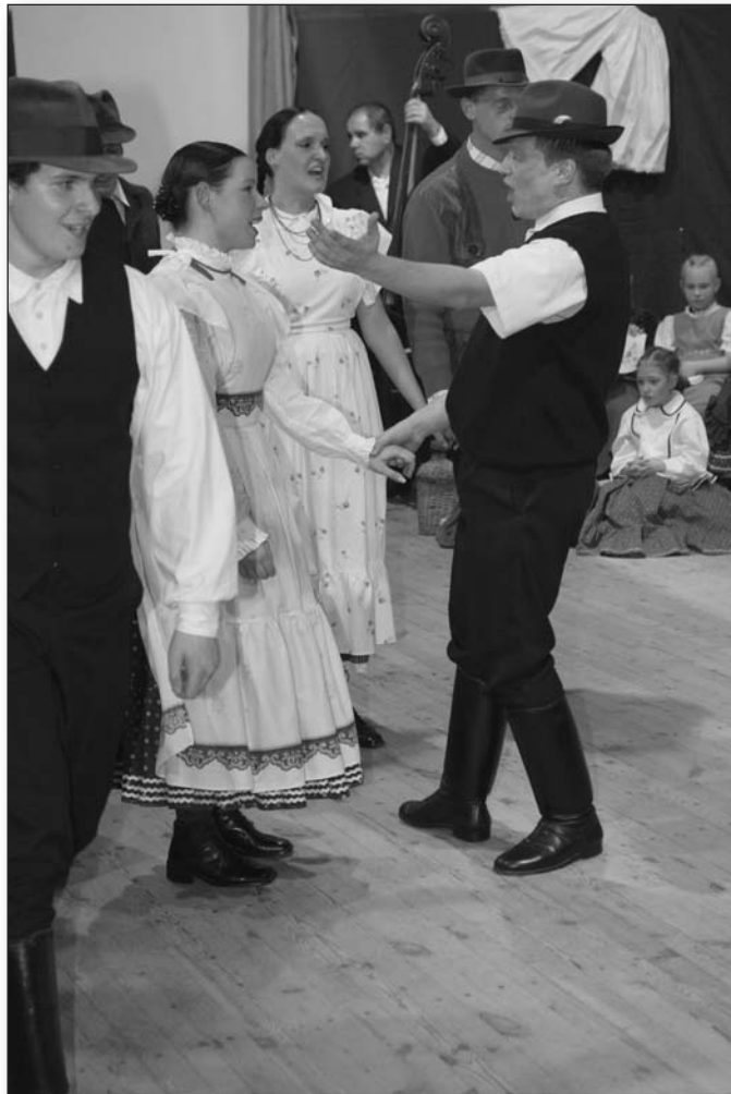
A népi tánc mindig népszerű

– Az a szívfájdalmam, hogy még azt a kevés energiánkat is szétforgácsoljuk. Mikor egyre kevesebb az állami normatíva és a költségterítés bevezetése miatt a szülők egyre kevesebb gyereket íratnak be művészeti oktatásra, nem kellene az energiánkat szétforgácsolni, hanem egy intézménybe kellene koncentrálni a pénzeket és az eszközöket – fejezte be nyilatkozatát a kuratóriumi elnök.