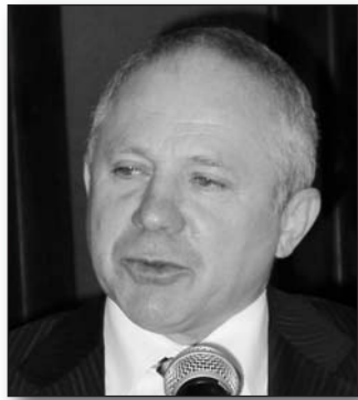
Várfi András polgármester

A munkahelyteremtés nem önkormányzati feladat – jelentette ki kérdünkre Várfi András, polgármester, majd hozzá tette – ugyanakkor, ha a képviselő-testület jól akarja feladatát ellátni, akkor fontosnak tartja, hogy a város lakói munkahellyel rendelkezzenek, ellenkező esetben nagyon sokan élnek önkormányzati segélyből. Bár az önkormányzatnak nem feladata, de mégis mit tehet a munkahelyek teremtése érdekében? – érdeklődtünk Várfi Andrásról.