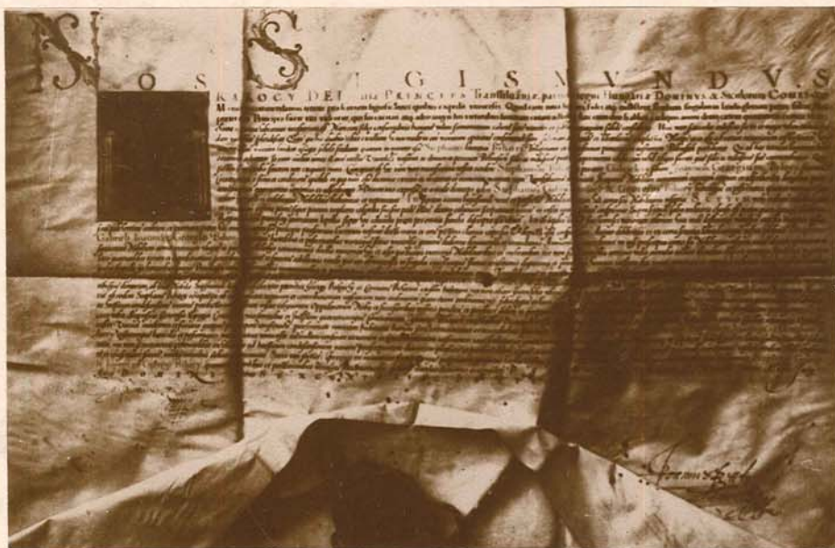
A BIHARY család címere és adományozó levele II. Mátyástól 1610-ből.