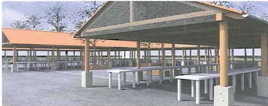
A gyomai piactér látványterve

Két városházi pályázat már nyert idén: 650 ezer forintot kapott Gyomaendrőd abból a nemzetpolitikai célú támogatásból, amely a testvértelepülési programok és együttműködésük megvalósítására fordítható. A másik nyertes pályázat pedig az Ovi Foci Program kapcsán a Százszorszép Óvodában megépült focipálya volt.