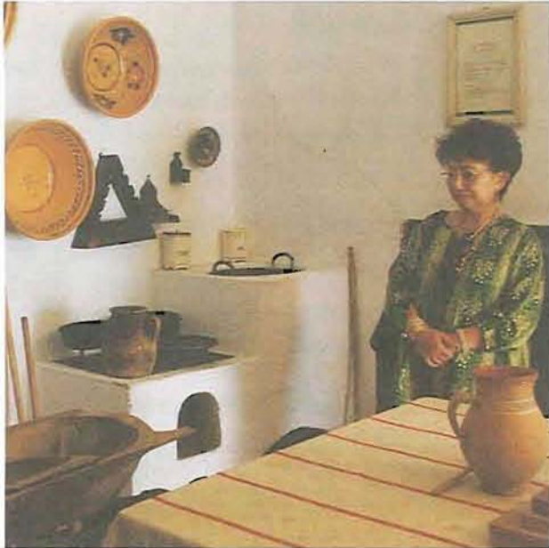
Az indonéz nagykövet asszony a tájházban ismerkedett meg a város múltjával

ségével. A menü indonéz Gadó-Gadó salátával kezdődött, majd a magyaros tárkonyos csirkeraguleves következett, a főétel Budapest bélszín volt indonéz rizzsel, a desszert pedig gesztenyepüré.