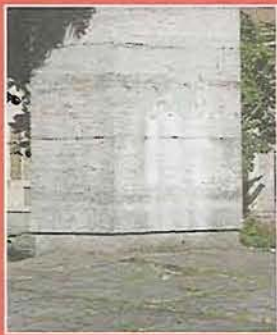
A feldarabolt emlékoszlophóból lennénk az új tér utókei

nek felhasználásával ugyanitt 11 millió forintért egy új teret alakítanak ki. Valószínűnek tartom, hogy minden gyomaendrődinek van olyan hozzátartozója, aki 1919-es hősnek számít. Amennyiben önök nem akarják megtartani az