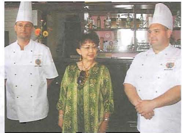
A Tímár Panzió éttermében a közelmúltban Indonéziában járt két gyomaendrődi mesterszakács fogadta a nagykövet asszonyt