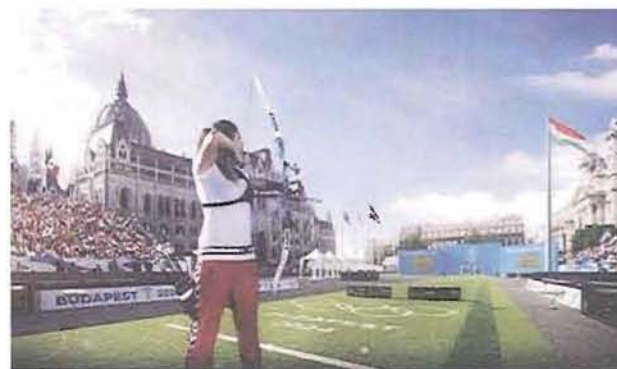
Az olimpiaiánk meghekkelésé szíven találta Magyarországot

Az a nem várt eset valósult meg, hogy a Momentum Mozgalom párttá alakult (Völgyesi bíró úr, és ifjabb Lomniczi Zoltán alkotmány jogász szerint) a