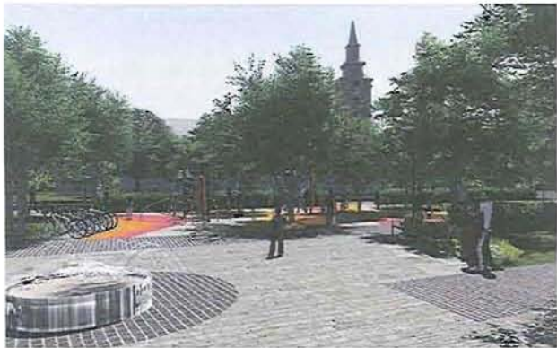
Az endrői Hősök tere látványterve. Erre 200 milliót nyert a város

Az önkormányzati épületek energetikai korszerűsítésére Gyomaendrőd két pályázatot is beadott, az egyik nyerhet a másik, - a Rózshegyi iskola épületének korszerűsítése - nem. Így csak a Selyem úti városháza épülete újulhat meg, ha a pályázatról végleges döntés születik a közeljövőben.