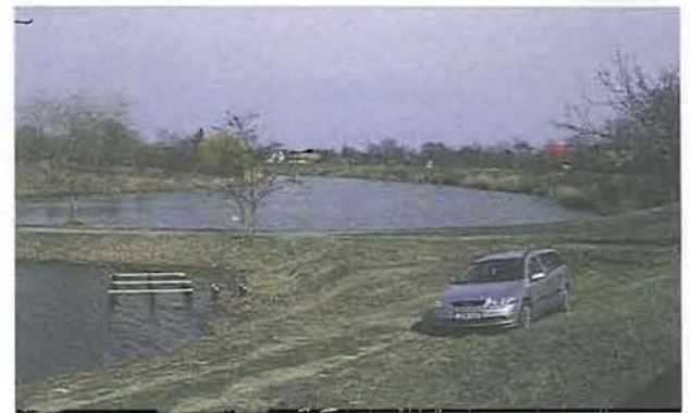
Bár a Fűzfás zug turisztikai célú fejlesztésére nem nyert pénzt a város, azért saját erőből egy városi stéget építettek a közmunkaprogram keretében

benyújtott pályázatát Gyomaendrőd Város Önkormányzata, azonban ez sem nyert. Támogatták viszont többek között Szarvas, Békésszentandrás, Békés ilyen irányú pályázatait.