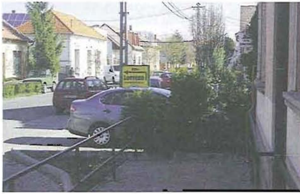
A Kossuth úti postahivatal - az átjárás lezárva

Tulajdonképpen nincsenek egyedül ezzel a megoldással. A Kossuth út járdátlannak nevezett oldala a Hősök útjától egészen a takarékszövetkezetig járdán járható, ám a pénzintézet telekhatáránál már egy sövény zárja el a továbbhaladást. A Kossuth úti festékboltnál pedig a bolt elé kirkott tavaszi virágok akadályozhatják a továbbjutást.