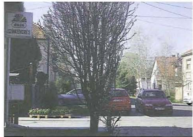
A Kossuth úti festékboltnál - az átjárás ideiglenesen lezárva