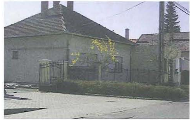
A Kossuth úti takarékszövetkezetnél - az átjárás lezárva

A kérelmek minden esetben egyedi elbírálásban részesülnek, amely során városképi, közlekedésbiztonsági és egyéb szakmai szempontok kerülnek figyelembe vételre.”