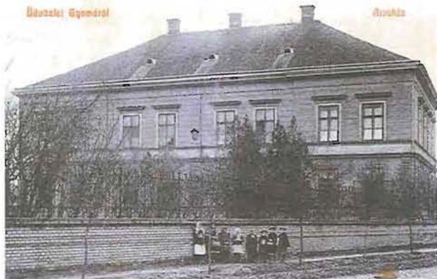
Az egykori Árvaház régen és ma. A Fő úti iskolaépület előtti teret alakítanák át

szülő Gyoma történetét feldolgozó könyv és a Gyomaendrödi Ki Kicsoda? című kiadvány megjelentetése mellett rendezvényekkel is emlékeznek az eseményre.