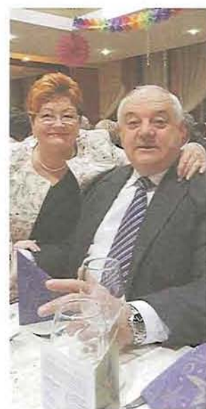
A Tímár házaspár

szféra, megjelentek a maszekok, jöttek a gazdasági munkaközösségek. Persze bennünk, vendéglátósokban is folyamatosan munkált az a gondolat, mi lenne, ha maszekban végezhetnénk a vendéglátást?!