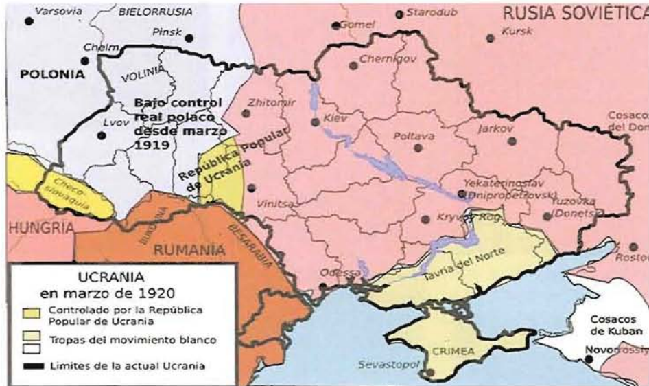
Az 1920-as lengyel határra és román határra rávetített mai „elméleti” ukrán határ

Erdélyben az '50-es években 2,5 milliós magyarság a rendszerváltás idejére 1,8 millióra, majd mára 1,3 millióra fogyott. Már nemcsak Kolozsvárott, hanem Marosvásárhelyen is alig hallani már magyar szót, mert a román olténiai és munténiai oláh migránsok százezreit költöztették be a '80-as évek óta kvóta alapján. A mindenkori magyar kormányok egyetlen egy esetben sem szabták a későbbben belépő szomszédjainknak a támogatásunk feltételül az autonómiát. Az 1944-1945-ös német náci megszállás, az 1945-1991-ös szovjet megszállás után, rövid nemzeti függetlenséget követően, amelyet a privatizációval történt