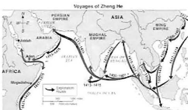
World History Communications to Today – Elisabeth Elis és Anthony Esler

A hajóhadban 62 óriás dobozhajó volt, a kísérő egységek közt voltak 110 méteres gyorshajók, 85 méteres szállítóhajók és 55 méteres felderítésvégző dzsunkák is. Csak akkor léptek fel katonai erővel, ha a tengerpart menti vietnámi, indiai,