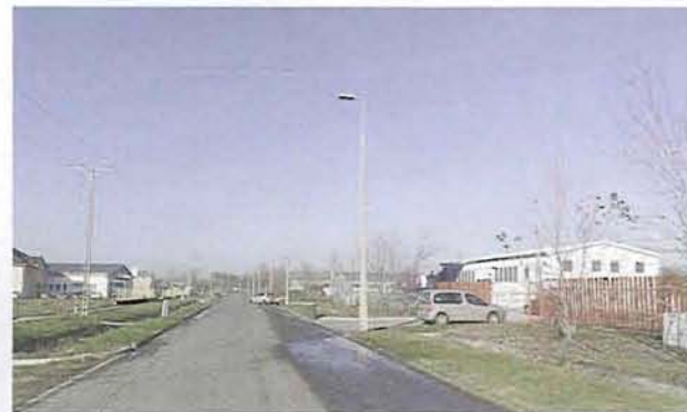
Az ipari parkban hat céghez törtek be

November utolsó hétvégéjén régen nem tapasztalt betöréssorozat történt Gyomaendrődön.