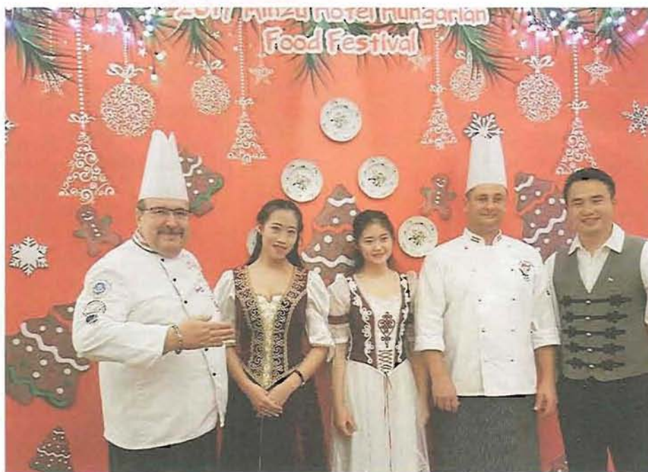
Hungarian Food Festival a Minzu Hotelben két magyar mesterszakáccsal

- A szövetség célja, hogy magyar gyártókkal közösen megismertessük a magyar ételeket a kínaiakkal, illetve, ezen a kapun keresztül lehetőséget teremtünk arra, hogy egész Kínába eljusson a rendkívül magas minőségű és igényes magyar élelmiszer-fogalmazott az elnök hozzátéve, hogy korábbi kiállítások már sikeresek