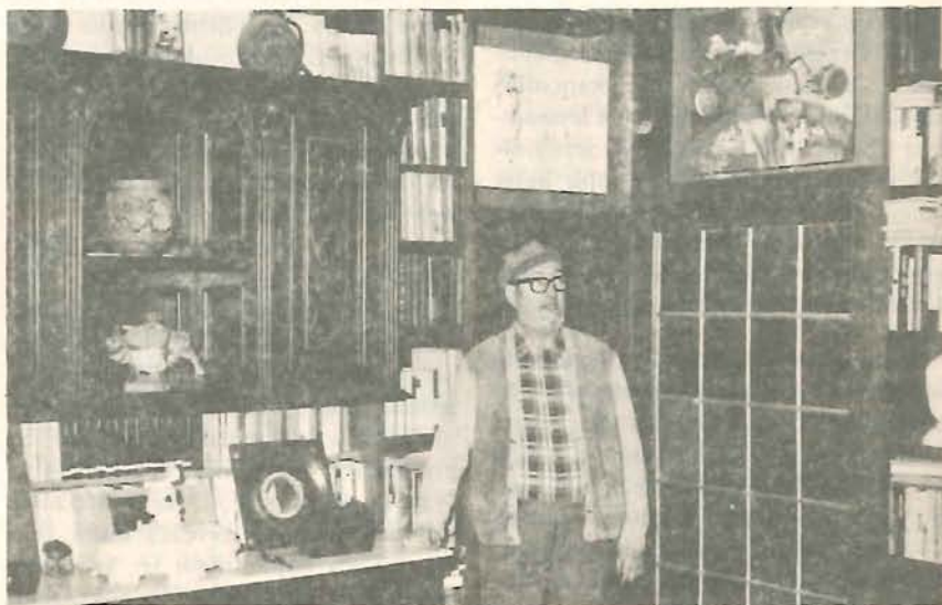
A művész lakása belülről