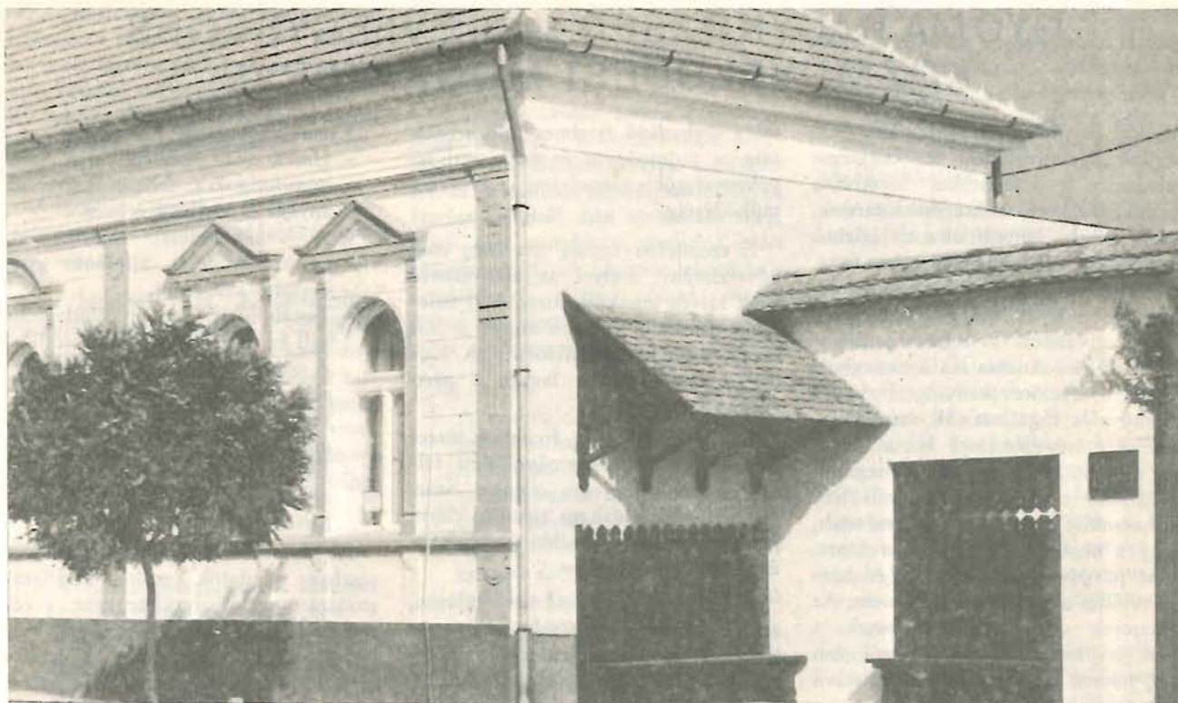
A Községi Könyvtár bejárata