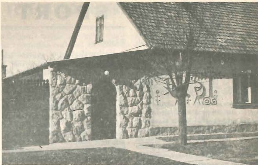
Honti Antal lakásának bejárata

Bartók művei napjainkban is felcsendülnek a világ szinte valamennyi színpadán. A világ legnagyobb karmesterei, mint például Arturo Toscanini, Herbert von Karaján, Leonard Bernstein, Dohnányi Ernő stb. már Bartók életében a világ leghíresebb zenekaraival szólaltatták meg műveit. Bartók zeneszerzői munkássága letisztult internacionalizmusának tükröz: zenéjével, cikkeivel, pedagógiai munkásságával azt hirdette, hogy a népek, különösen a szomszéd népek egymásra utaltak és testvérként kell egymás mellett élniük. Tisztelte, szerette és gyűjtötte a szomszéd népek zenéjét: is, így tette világszerte ismertté például a román népzene. A román és szlovák népzenei kutatás ma is az ő általa megkezdett úton halad.