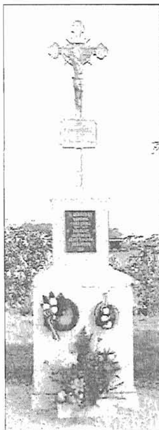
A volt Csáki Iskola keresztye

mert az Úr ott áldást ad: életet mindörökre.” 133. Zsoltár