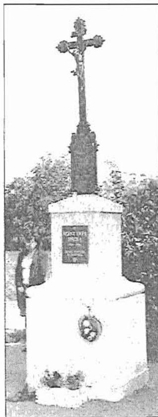
A volt Szent Imre Iskola felújított keresztye