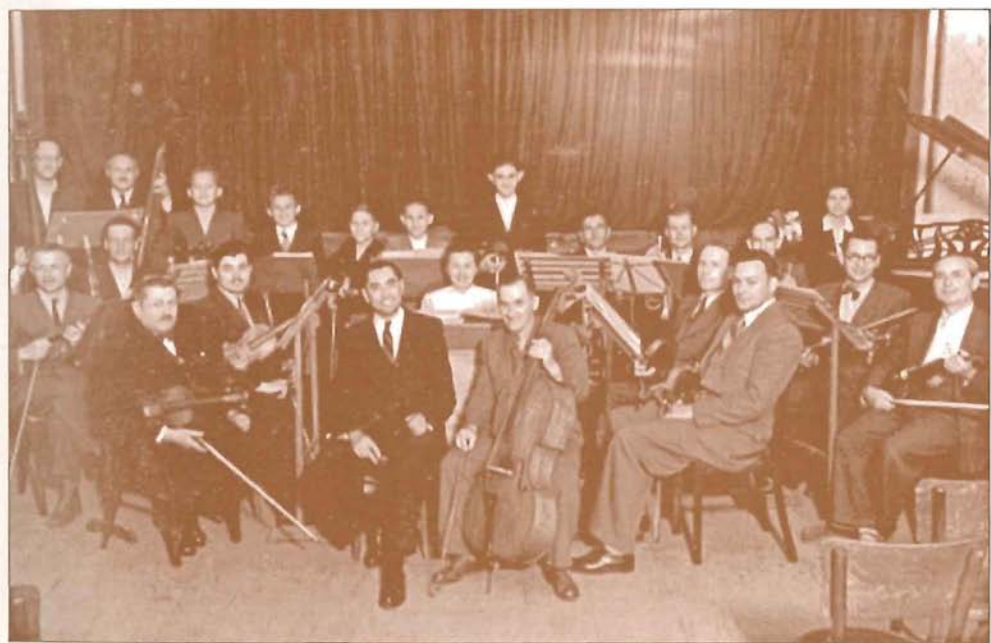
Pedagógus Szakszervezet zenekara