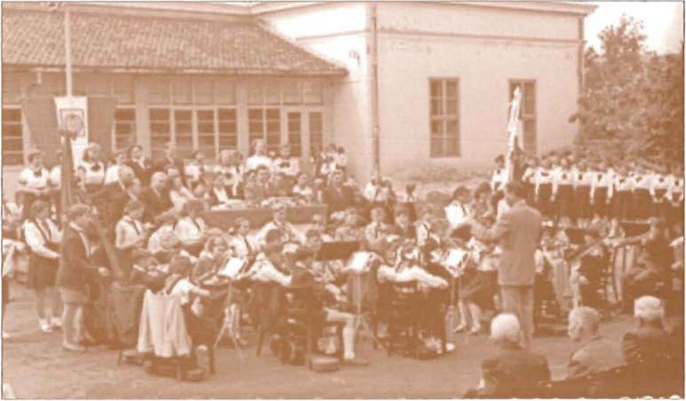
Úttörőzenekar szereplése a II. Számú Általános Iskola fennállásának 70. évfordulóján Gyoma, 1956. június