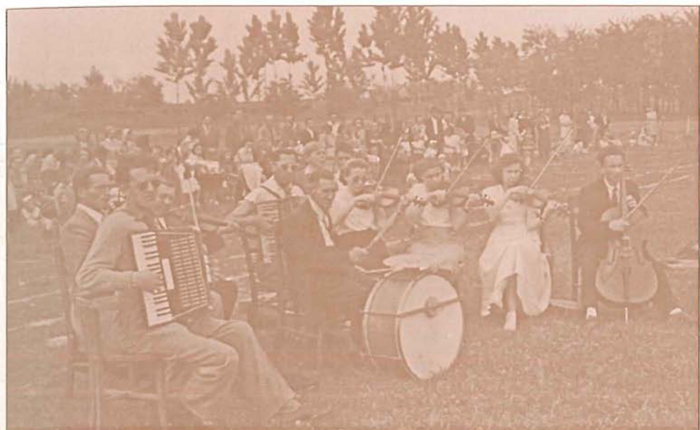
A Sportpályán játszik a pedagógus zenekar