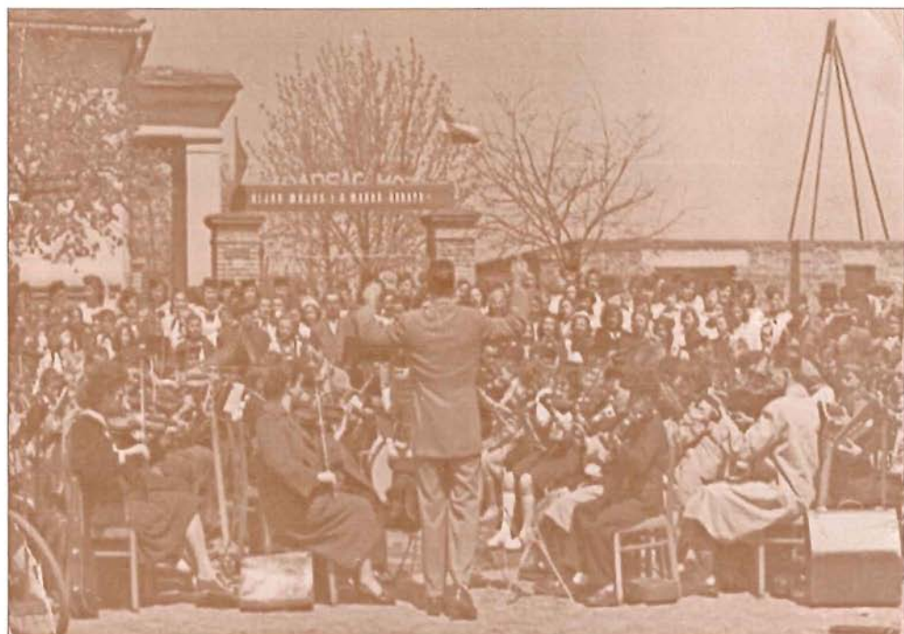
Száztagú ifjúsági zenekar Gyoma, 1958. május 1.

Munkásságának elismeréséért számos érdemérmet, elismerő oklevelet, kitüntetést és miniszteri dicséretet kapott.