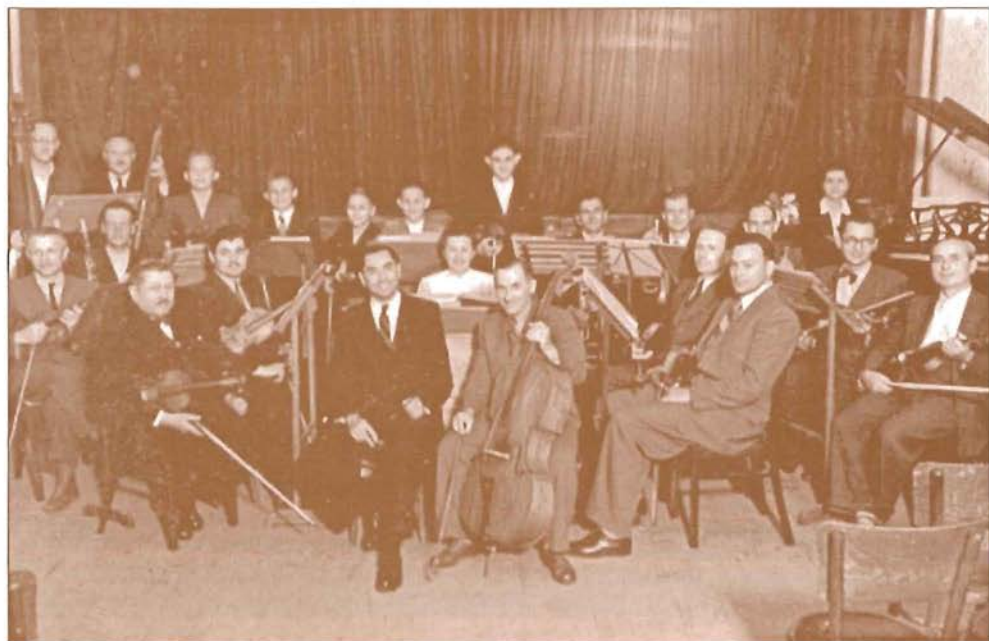
Ünnepség a Hősök úti iskola udvarán