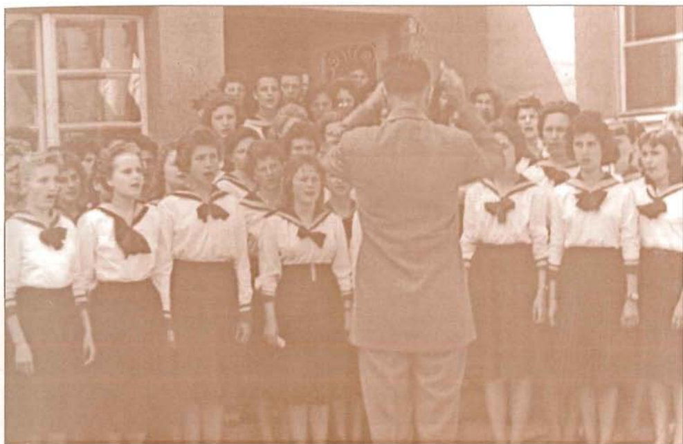
Gyomai Óvónőképző énekkara