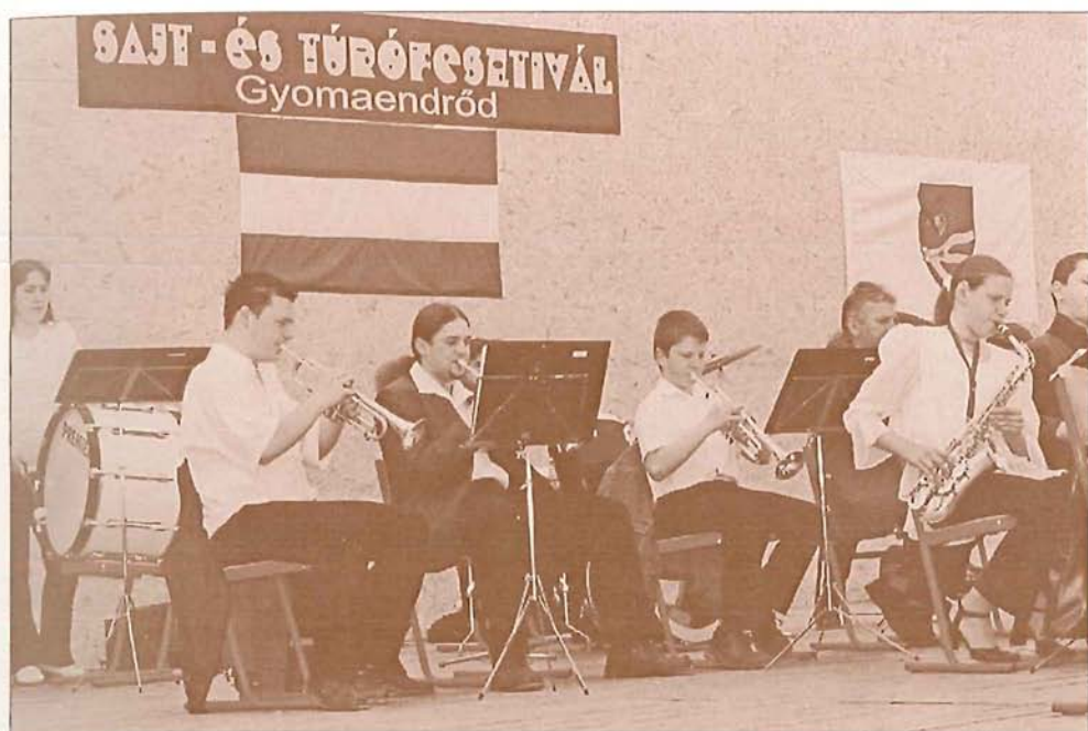
Sajt- és Túrófesztivál