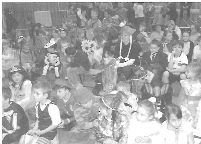
Farsangi jelmezeselek egy csoportja

Az iskola életéről további információkat, képeket találhatnak az iskola honlapján: www.rozsahegyiiskola.hu