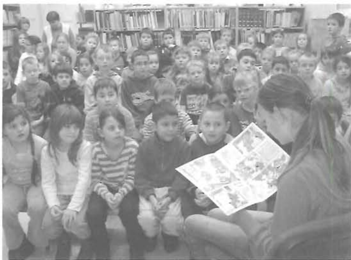
A debreceni rendezvényből: a nagyok meséltek a kicsiknek

A Regionális Hulladékkezelő által kiírt rajzpályázatra a