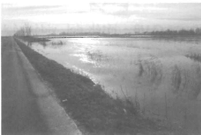
Ameddig a szem ellát, csak víz

A településőrök dokumentálják az eseményeket a problémás helyeken, és ennek megfelelően történik az intézkedés. Lakóingatlanokban nem keletkezett kár eddig, remélhetőleg így is marad.