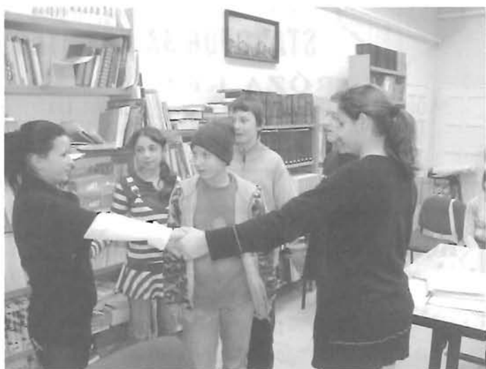
Kinél van az információ...

A kifejező olvasás témakörében sor került felolvasásra, blattoló olvasásra, saját szöveg felolvasására, mesemondásra. Dinamikus olvasás során fejlesztették a peri-