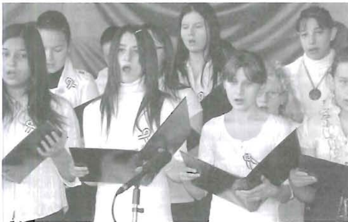
Az énekkar '48-as dalokkal színesítette a műsort (A Rózsahegyi iskola hírei a 9. oldalon)

A KARDIOLÓGIAI RENDELÉS IGAZ TÖRTÉNETE ..... 5. oldal Visszavárjuk Sipos Attilát ..... 2. oldal Magas kitüntetést kaptak! ..... 5. oldal A Jobbikot nem hagyom el ..... 3. oldal Mi történt a HÓTERMÉNÉL ..... 4. oldal