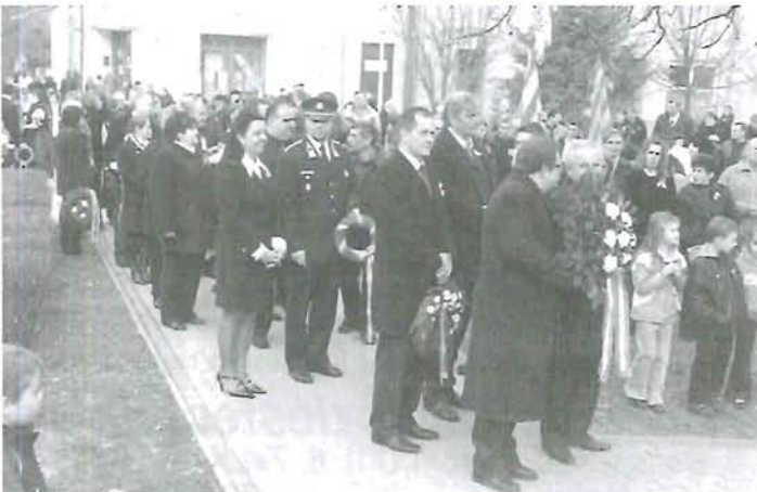
Március 15-i koszorúzók egy csoportja