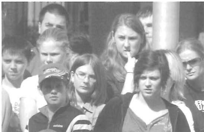
A közönség az esemény hatása alatt Ez lett a „nóta” vége!