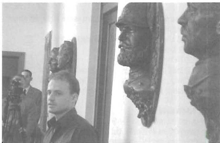
A művész és szobrai