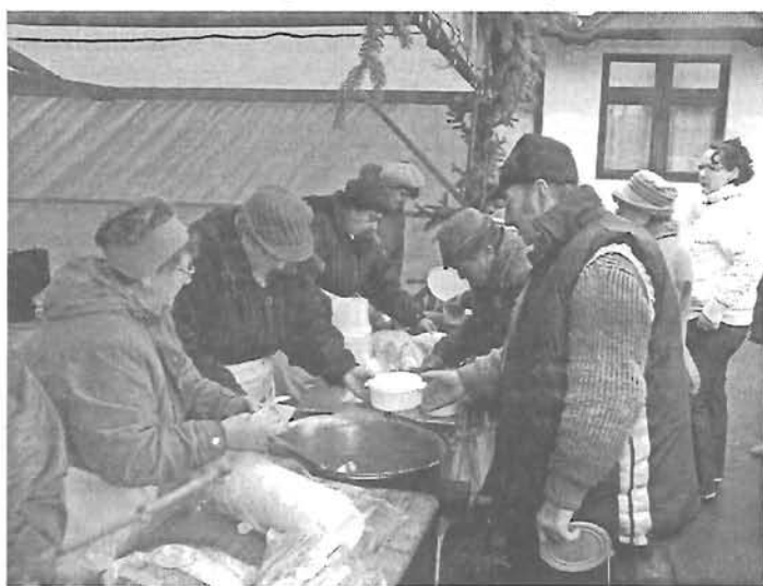
Kevesen jöttek el a szeretet-együttlét rendezvényére, a Mindenki Karácsonyára