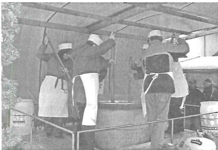
Ahol többen keverik a kaját!