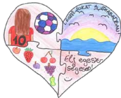
A rajzot készítette: Bánrévi Hanna A rajz a szülő hozzájárulásával jelent meg.