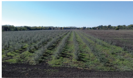
meglévő homoktövis ültetvény (5 ha)

A kiállításon, a közfoglalkoztatási mintaprogramokban, az értékkeremtő tevékenységekkel előállított termékeket lehetett megtekinteni, vásárolni. A megyei kiállítást követően Budapesten, a Millenárison került megrendezésre a IV. Országos Közfoglalkoztatási Kiállítás, és Vásár, amelyre ebben az évben is meghívást kapott Gyomaendrőd Város Önkormányzata. Az országos kiállítás is nagy érdeklődés mellett zajlott, a termékek eladása is sikeres volt.