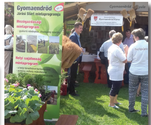
IV. Országos Közfoglalkoztatási Kiállítás és Vásár, Gyomaendrőd Város Önkormányzatának standja

szereződés keretében biztosítja a foglalkoztatásához szükséges létszámot, valamint a foglalkoztatottak 100 %-os bérköltség támogatását, továbbá a feladatok elvégzéséhez szükséges eszközöket, valamint a felhasznált anyagok (építőanyagok, vetőmagok, szerszámok) egy részét.