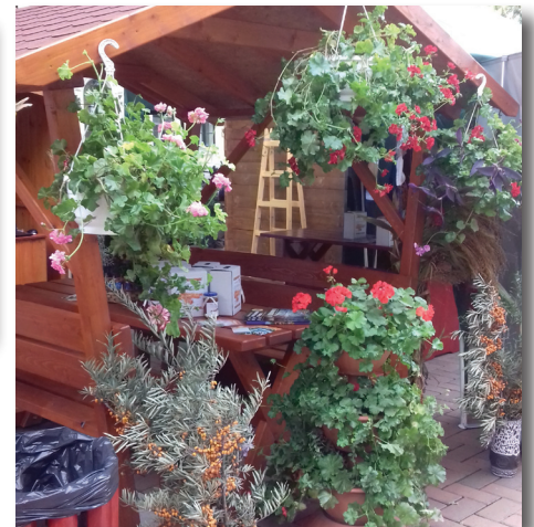
Megyei Közfoglalkoztatási Kiállításon, Gyomaendrőd Város Önkormányzatának standja

A közfoglalkoztatási programban előállított homoktövis ivólé, az elkészített seprűk, a kertészetben előállított virágok Gyomaendrödon az Alkotmány utca 5. sz. alatt hétköznapi hétfőtől-péntekig 7 órától 14 óráig megvásárolhatóak.