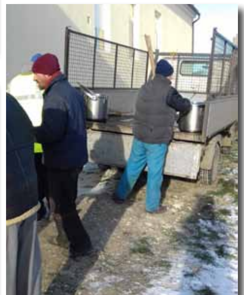
A közfoglalkoztatottak részére teaosztás

Farsangolunk! Jelmezek kölcsönözhetőek Farsangi kiegészítők vásárolhatók Álarcok Kalapok Parókák Fegyverek