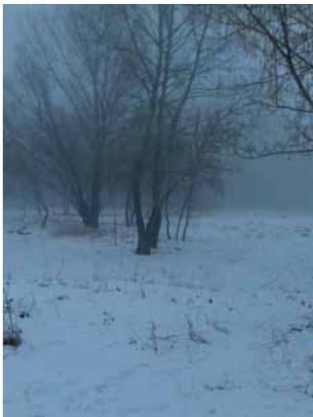
Körös Maros Nemzeti Park

A hosszabb időtartamú közfoglalkoztatás keretében a Luther utca 2. szám alatt egy 84 m 2 alapterületű a gépjárművek állagának megővését szolgáló szín készült el. A szín a mintaprogramokban beszerzett eszközök, gépek tárolását is szolgálja.