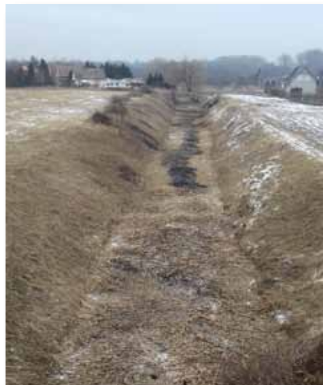
Bónom zugi holtág összekötő csatorna

A járási „bio” mintaprogram keretében a Körös Maros Nemzeti Parkkal kötött megállapodás alapján elkezdődött a gyalogakác cserjék kitermelése a Hármaskörös folyó árterében. A kitermelt nyersanyagot, a program keretében beszerzett ágdaráló segítségével feldaráljuk, és felhasználjuk a kertészet fóliáinak fűtésére, valamint a Luther utca 2. szám alatti épület fűtésére.