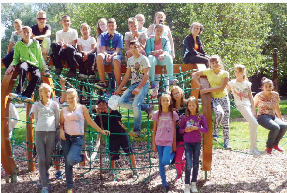
A játszótéri pákaszálón minden táborozó elfért.

Ezalatt az egy hét alatt tartalmas programokon vettek részt: sétáltak Kecskemét és Baja belvárosában, utaztak kisvasúton a Gemenci-erdőben, Bakódpusztán láttak egy csodálatos lovasbemutatót, sütöttek tökkipompost, végigsétáltak a Kékmoszat tanösvényen és csónakból figyelték a tó élővilágát. Szabadidejükben számháborúztak, nyársaltak, sportjátékokat játszottak, strandoltak és egy izgalmas éjszakai túrán vettek részt. Élményekkel, barátságokkal gazdagodva tértek haza.